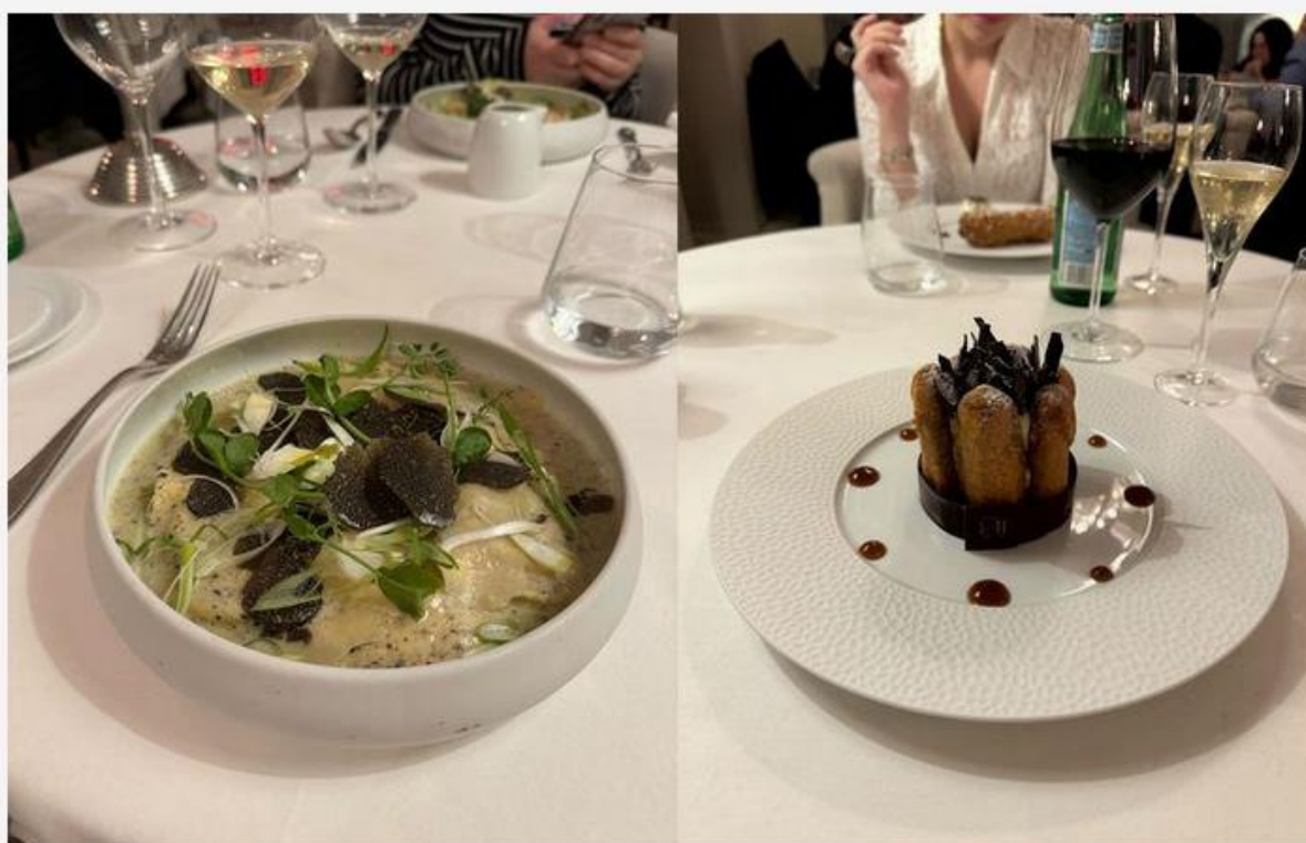
La Storia au Royal Hainaut

Pour ceux qui aimeraient ensuite poursuivre la soirée dans un endroit plus cosy, que celui du bar lounge, il est possible de prendre la direction du royal bar. Un endroit très douillet, où l'on retrouve un billard, des bibliothèques et des fauteuils en velours. Au milieu de la pièce, un imposant bar où un mixologue laisse parler sa créativité. Nous rassurons ceux qui préféreront se coucher directement après le repas, les chambres sont parfaitement insonorisées et situées au calme dans les étages supérieurs.